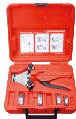
Obr. Sada TUBE BENDER