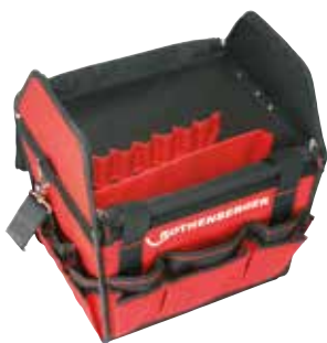
Obj.č. 402311 (volitelné)