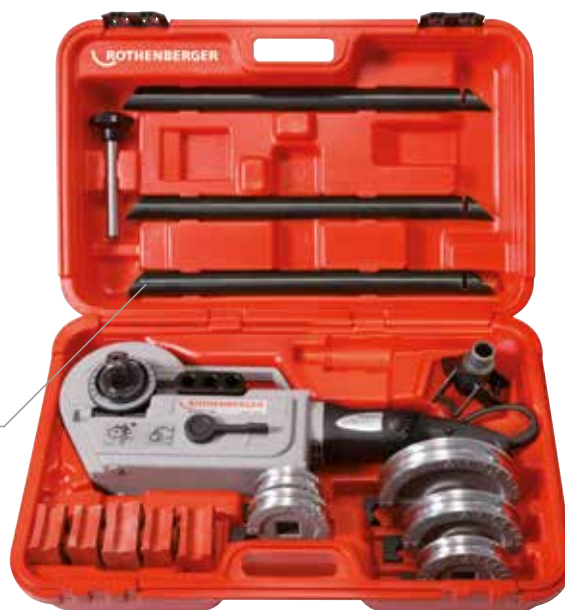
Obr. ROBEND® 3000 Set

Zajišťuje optimální rozprostření kluzného prostředku