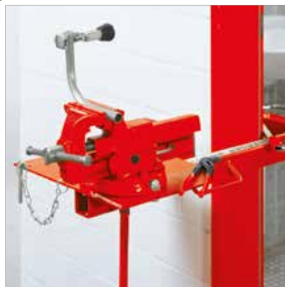
Otvory pro paralelní svěrák (obj.č. 070705X) a otočný talíř nejsou obsaženy v dodávce