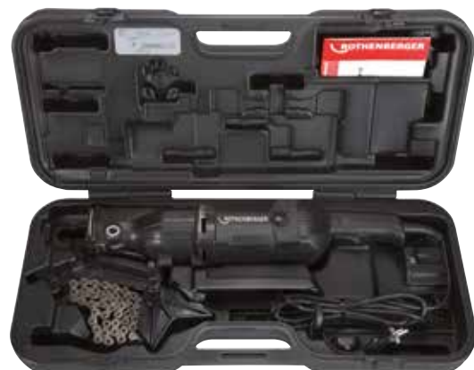
ROTIGER VARIO Electronic