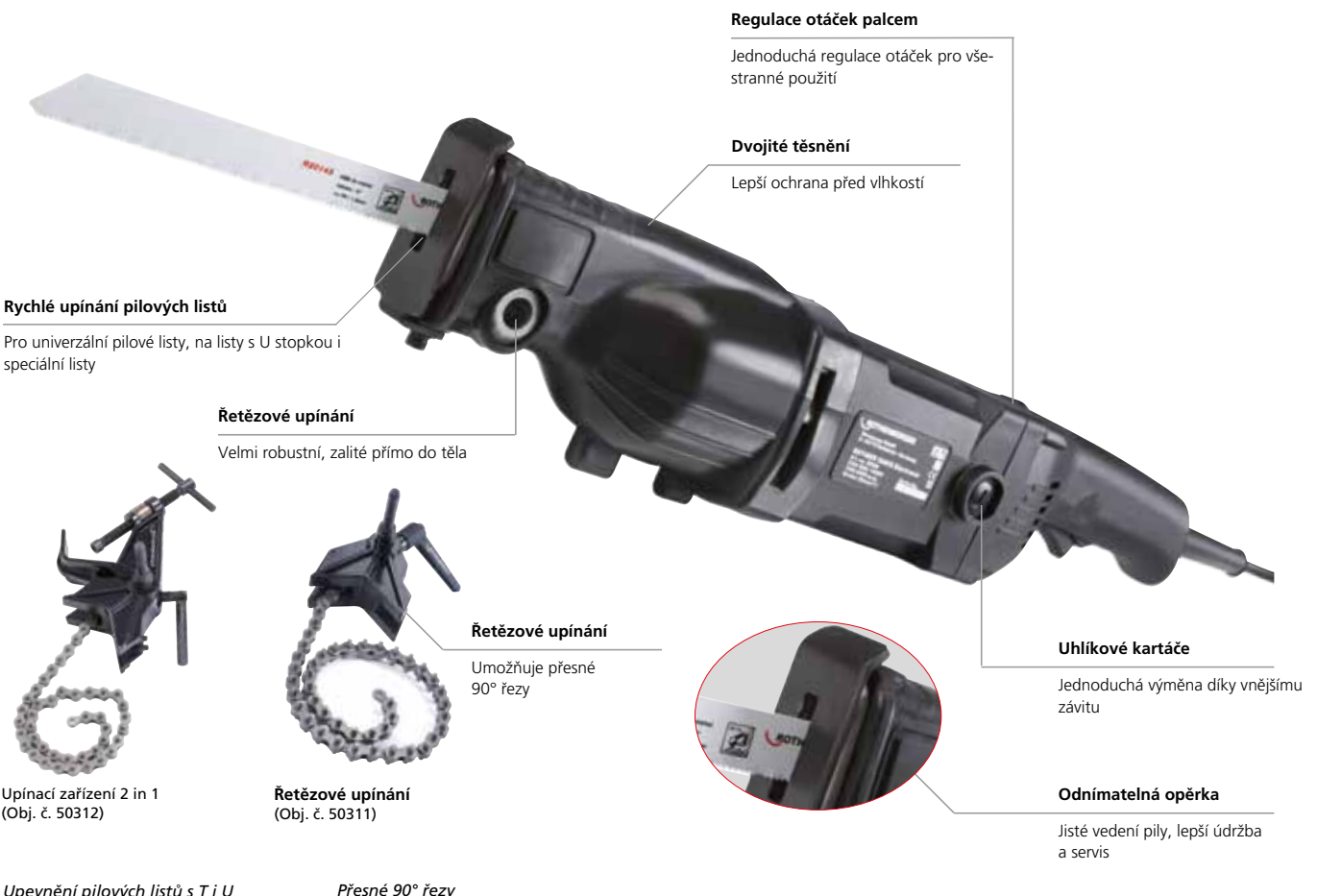
Upínací zařízení 2 in 1 (Obj. č. 50312)