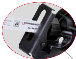
Dvojitě těsnění Lepší ochrana před vlhkostí