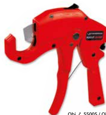
Obj. č. 55005 / Obj. č. 55015