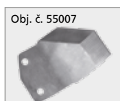
Obj. č. 55007