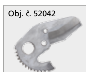
Obj. č. 52042