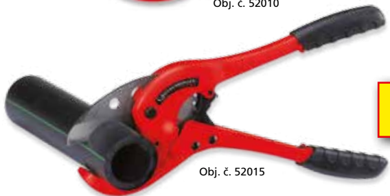
Obj. č. 52015