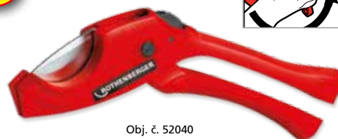
Obj. č. 52040