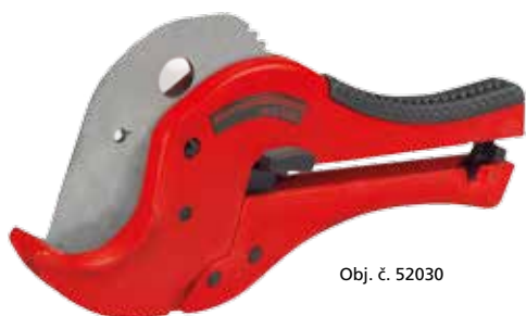
Obj. č. 52030