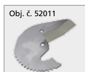
Obj. č. 52011