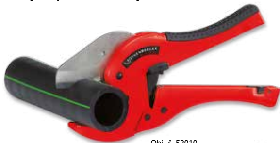
Obj. č. 52010

Nůžky na plastové trubky až do Ø 75 mm (3")