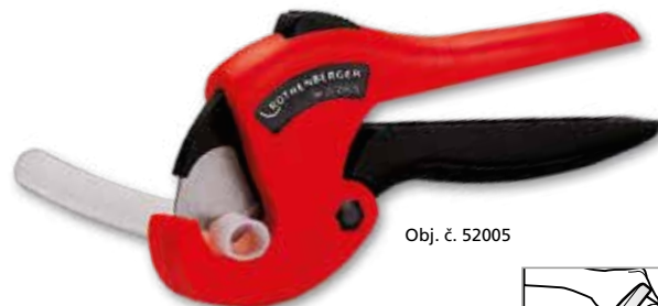
Obj. č. 52005

(TC 32 na vícevrstvé trubky z MSR (plastohliníku))