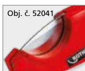
Obj. č. 52041