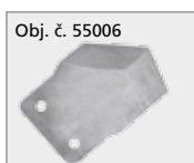
Obj. č. 55006