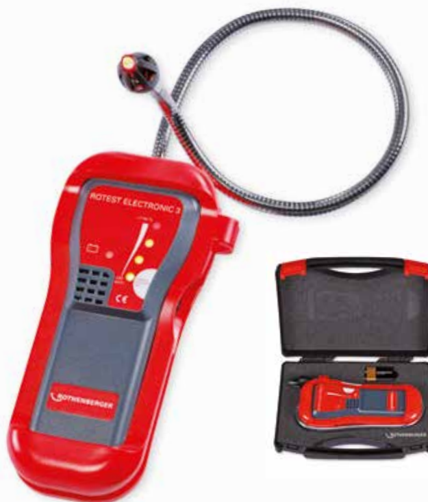
Snadná lokalizace místa úniku

Detekuje: aceton, butan, metan, propan a zemní plyn, alkohol, amoniak, benzol, etylen, benzín, vodík, průmyslová rozpouštědla, turbínové palivo, odlakovače, naftu, toluen, CO 2 Citlivost: < 50 ppm – 1 Vol % (metan) Napájení: 1 x 9 V lithiový článek, typ SLM 9 V